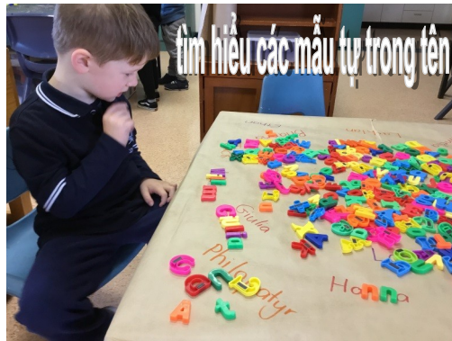
Tìm hiểu các mẫu tự trong tên