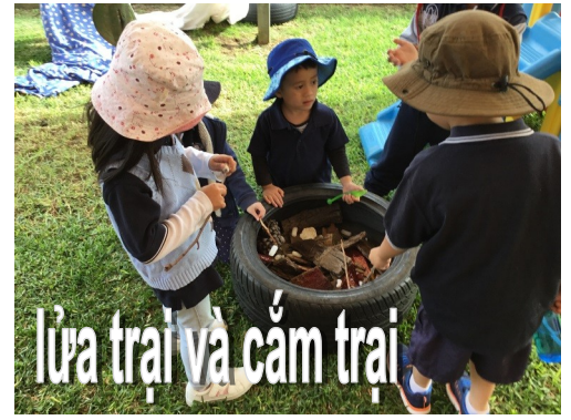
Lửa trại và cắm trại