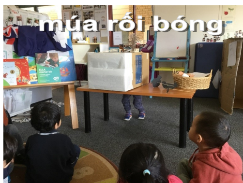
Múa rối bóng