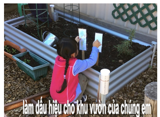
làm dấu hiệu cho khu vườn của chúng em

Chúng ta nhìn nhận là trường chúng ta nằm trong đất nước Kaura. Chúng ta ghi ơn và tôn kính người Kaurna là những người tiếp tục gìn giữ đồng bằng Adelaide và tỏ lòng tôn kính các bậc Trưởng thượng trong quá khứ lẫn hiện tại.