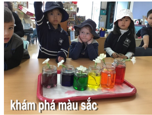
Khám phá màu sắc