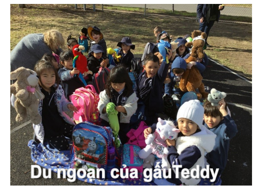
Du ngoạn của gấu Teddy