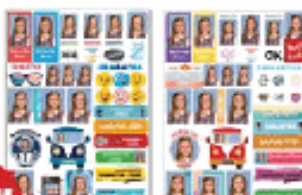
48 Personalised Stickers

Please note: Traditional or Composite group and the presentation format are chosen by your school. Sibling photos, if available, can also be ordered online and must be ordered prior to your photo day. A late fee will apply for photos purchased after ordering has closed.