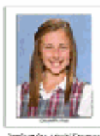
Refer to back frame